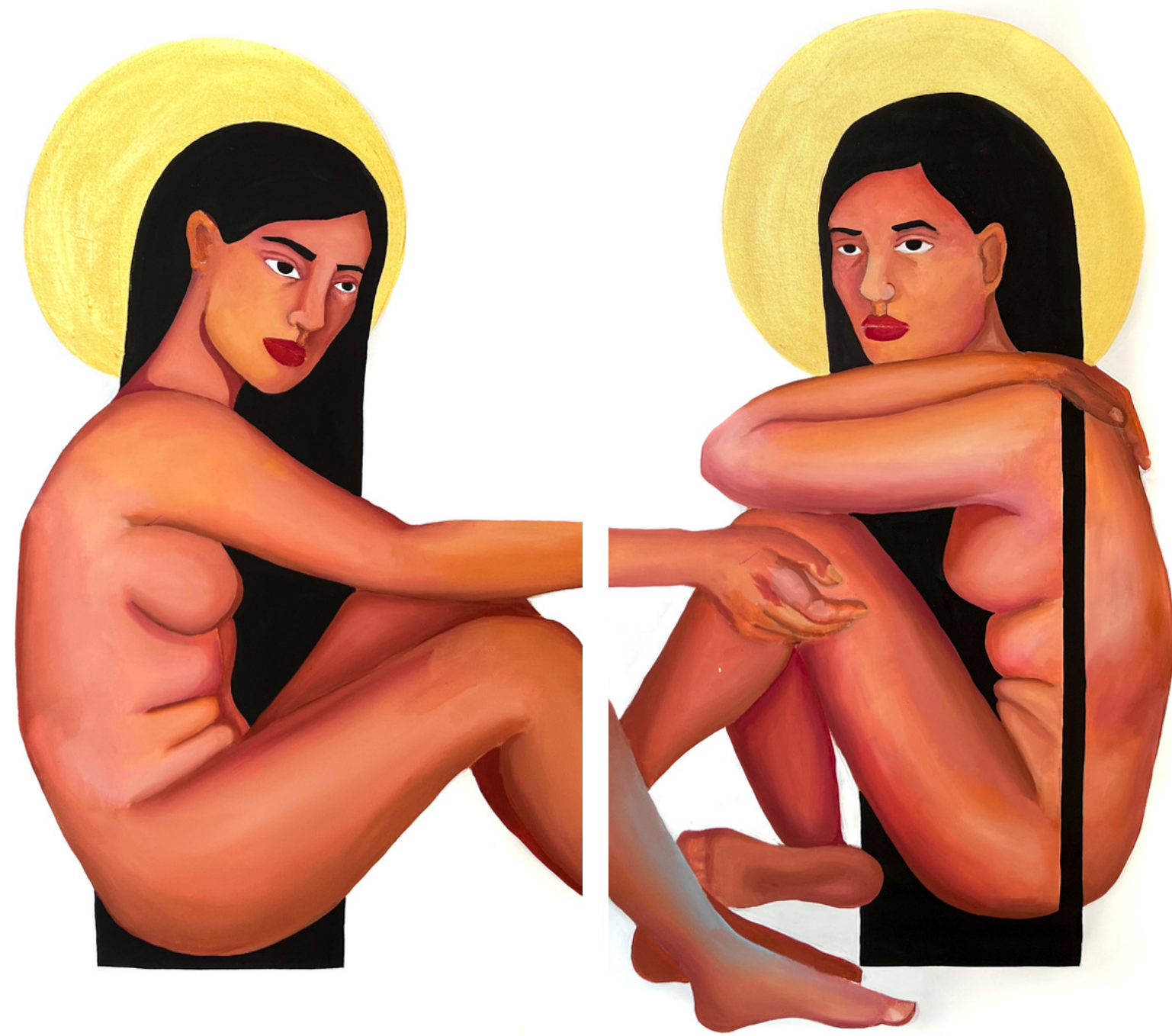
Acrylic on canvas, 2022 Diptych, 50 x 100 cm