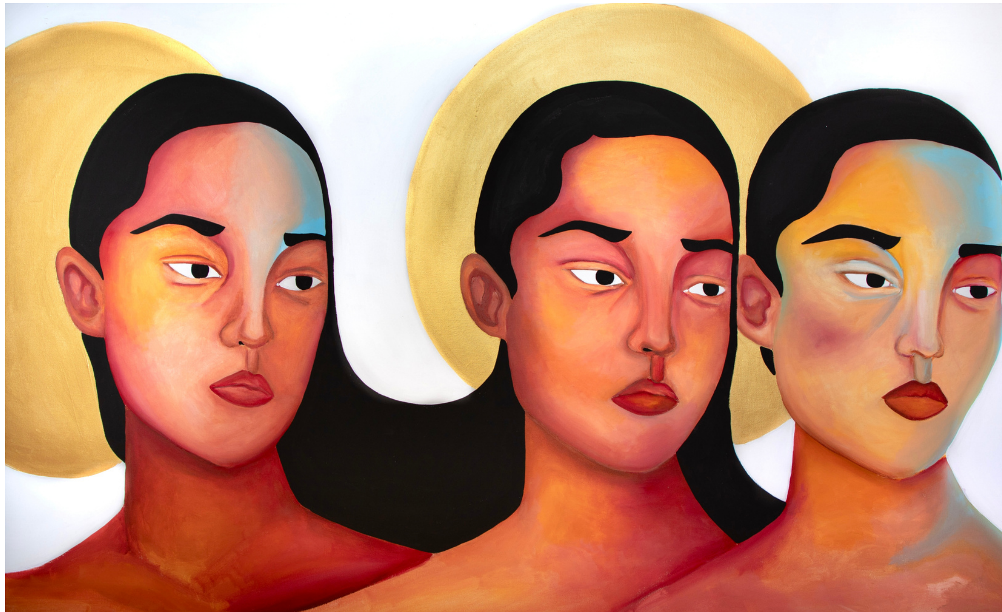
Acrylic on canvas, 2023 148 x 89 cm