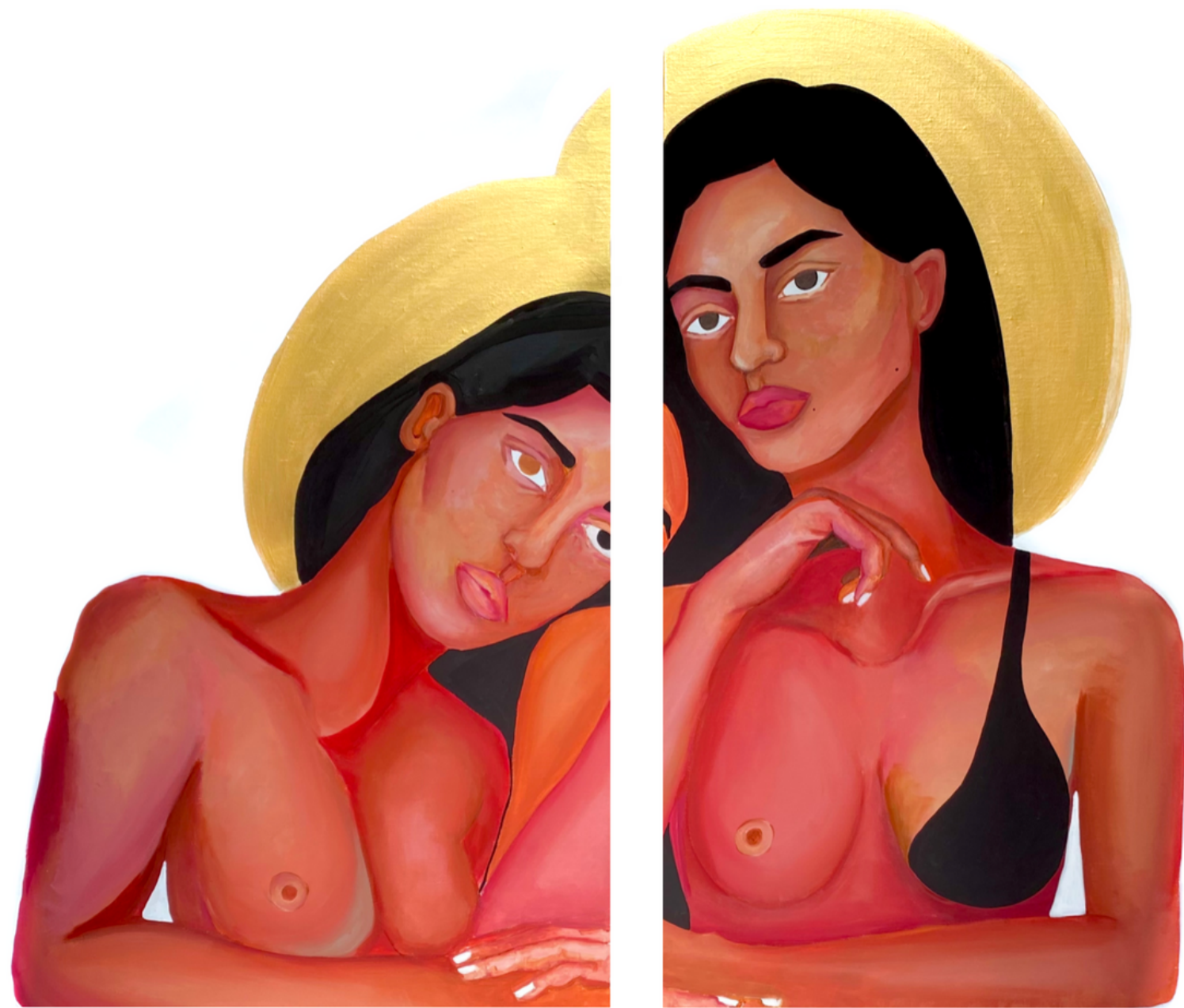
Acrylic on canvas, 2022 Diptych, 92 x 60 cm